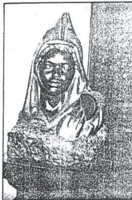
Derbuka, instrument marroquí. X Medalla Julio Antonio 1954

Serà aquesta l'última etapa de la seva vida, i probablement la més creativa. Treballà amb els materials propis del país, aconseguint resultats impressionants, d'una força i d'un vitalisme escultòric únics. Alguns el denominaren «el poeta de la raça» i la seva obra d'«Estudios Africanos» es troba repartida entre Amèrica, Àfrica, països europeus i les peces conservades actualment al Museu Comarcal de Reus i a l'estudi particular propietat de la família. Morí a Bata «Guinea Equatorial» el 29 d'octubre de 1983.