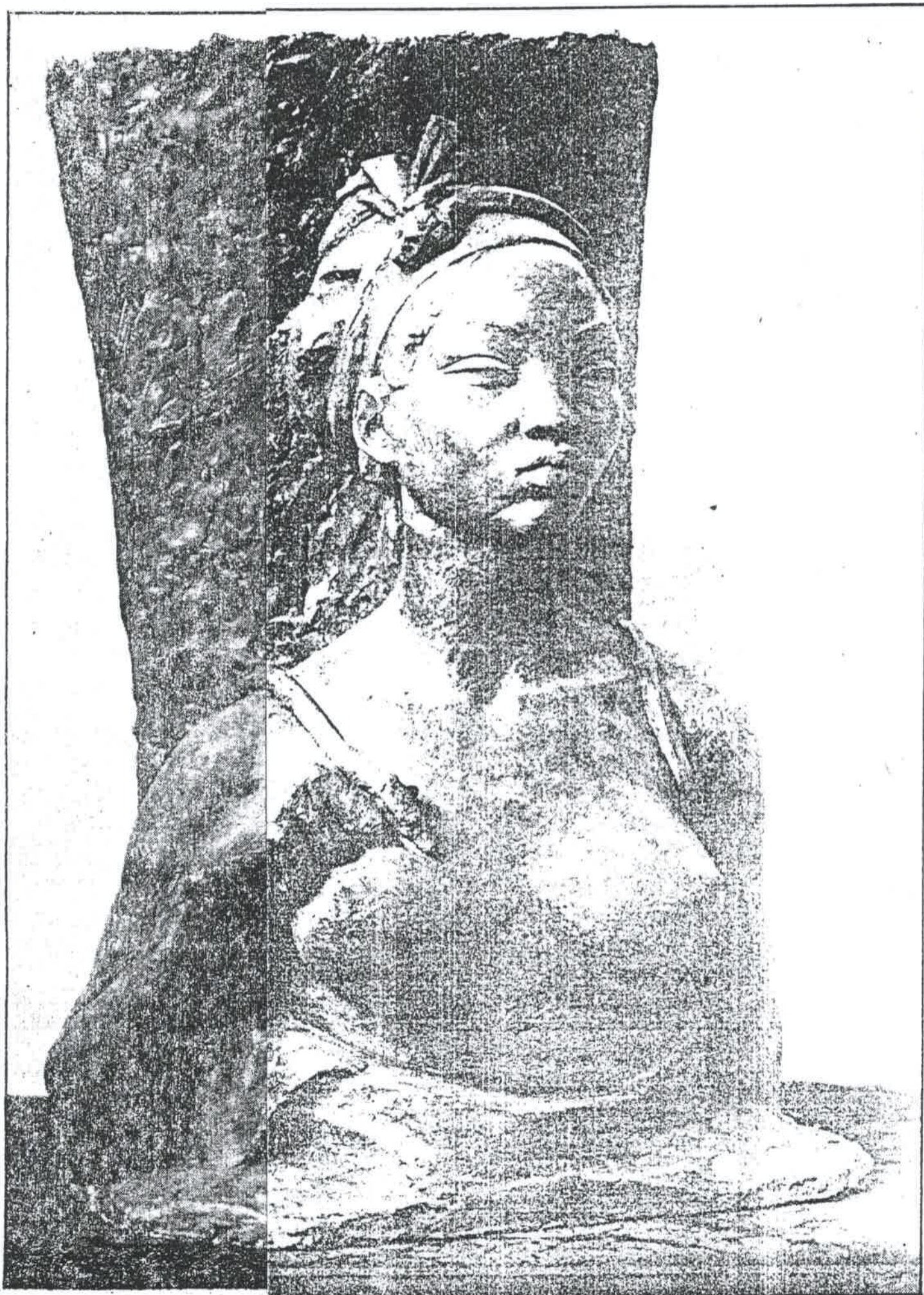
«Nkuó». Dona amb cistell a l'espatlla.

felix si els nets i els ciutadans de Guinea em n «Gené el Africano»