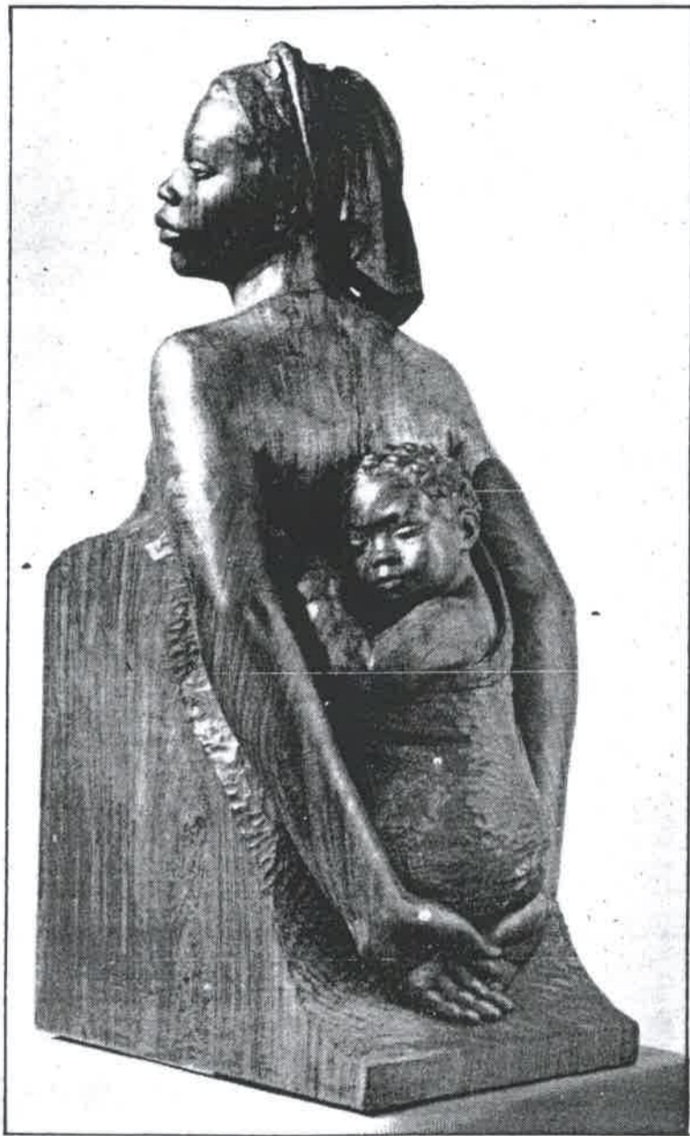
«Oberi». Talla efectuada en tabac. 1961

Intentar de donar un esbós biogràfic és relativament fàcil però no pas deixar constata des dels mils i mils obres d'art que el tarannà sempre in-