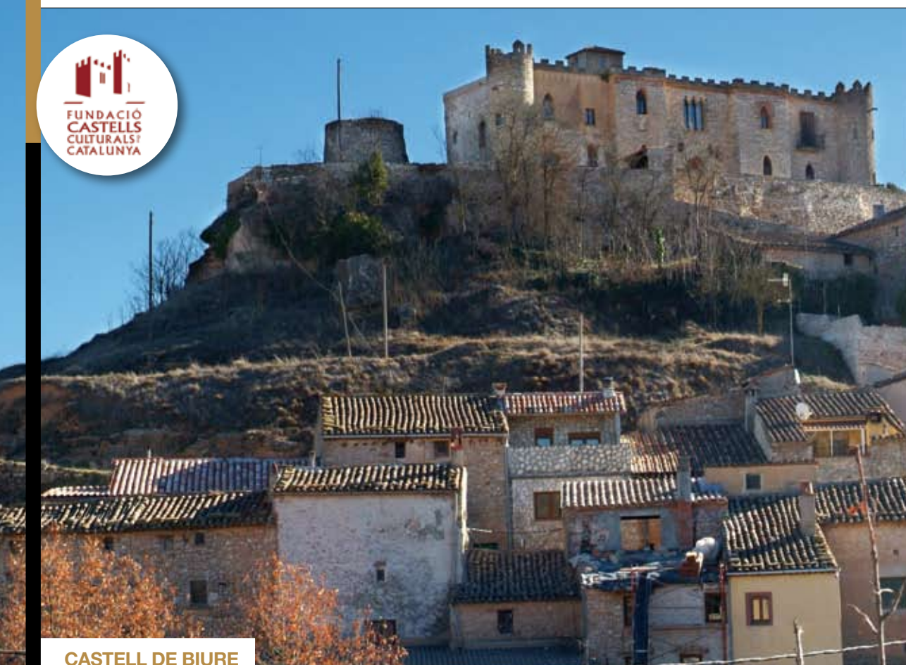
CASTELL DE BIURE