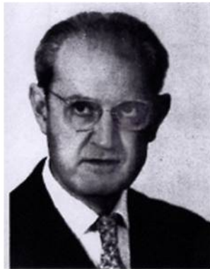
Guillem Colom i Ferrà, poeta que tingué els seus inicis literaris en els Jocs Florals de Montblanc l'any 1917