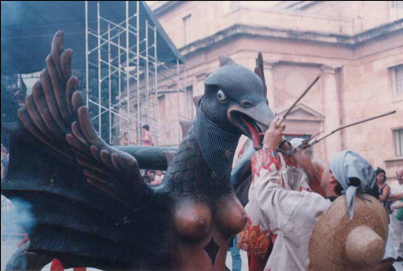
La Víbria, la serrallenca