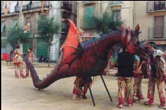
El drac de Sant Roc